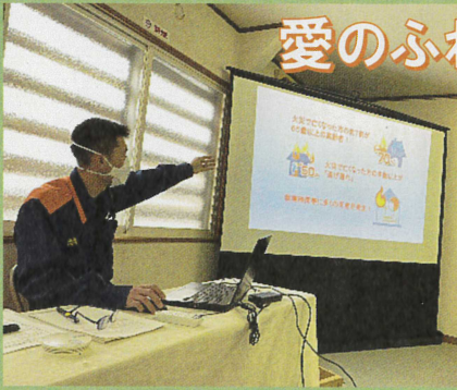
東光東自治会の住宅火災予防教室

社協が推進する「愛のふれあい交流事業」は、住み慣れた場所で馴染みの人達に囲まれながら、健康で安心して暮らすことを目的とした地域(自治会)での助け合い活動です。