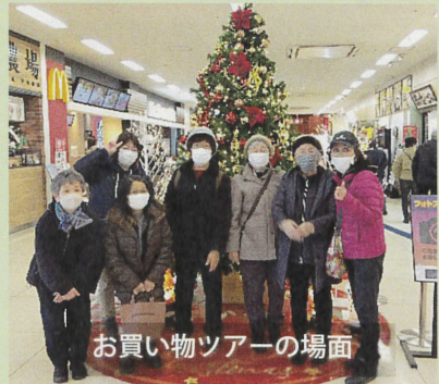
お買い物ツアーの場面

中央町自治会では、愛のふれあい交流事業助成金(バス等借上助成)を活用してタクシーの運賃に充て、長い距離を歩くことが難しい方も地域交流の集い活動に参加しやすいよう、会場までの移動をサポートしています。