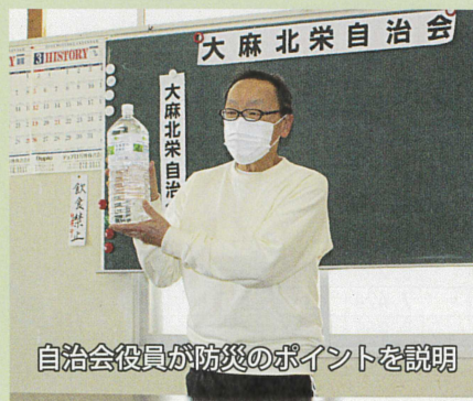
自治会役員が防災のポイントを説明

災害発生時の役割分担を整理しておく、誰がどう動き何が必要なのかを把握しあい、災害時の避難を想定しておくことができます。