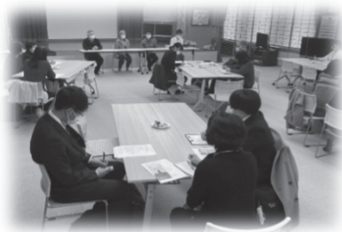
【当事者会の様子】→ ゲームや雑談で楽しい時間を… カードゲームやボードゲーム等各種ご用意しています！