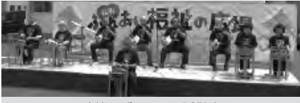
三味線などによる民謡発表