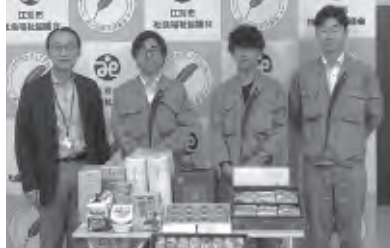
○角山開発(株)様から食料品寄贈