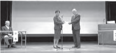
○江別市高齢者クラブ連合会(女性部)様から車いす寄贈(会場では目録)