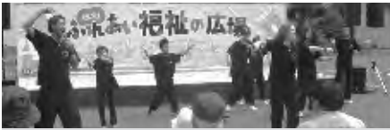
ダンスパフォーマンス

また、参画した23団体からは、バザーの売上等の中から社会福祉基金へ192,883円の寄付をいただいたほか、共同募金コーナーでは能登半島地震への義援金として29,154円の募金が集まりました。