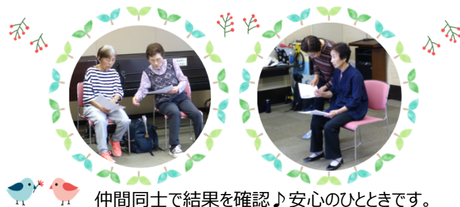
仲間同士で結果を確認♪安心のひとつです。