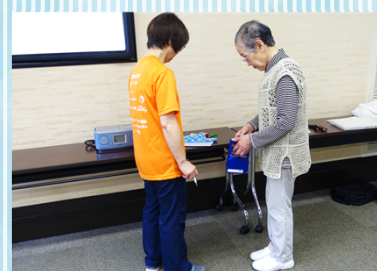
10m歩行、最大一步幅など、脚力を中心とした体力を測定します。