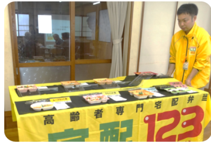
どのような食事が届くのか、見本品の展示がありました。

講話の後は、バイキング方式による試食会で、なかなか出来ない体験に会場は大変に盛り上がり、口々に感想を伝えあっていました。