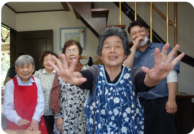
スタッフ総出のお見送りの様子も、元気いっぱいです。