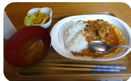
スパイスから丸1日かけてつくった、本格絶品チキンカレー！