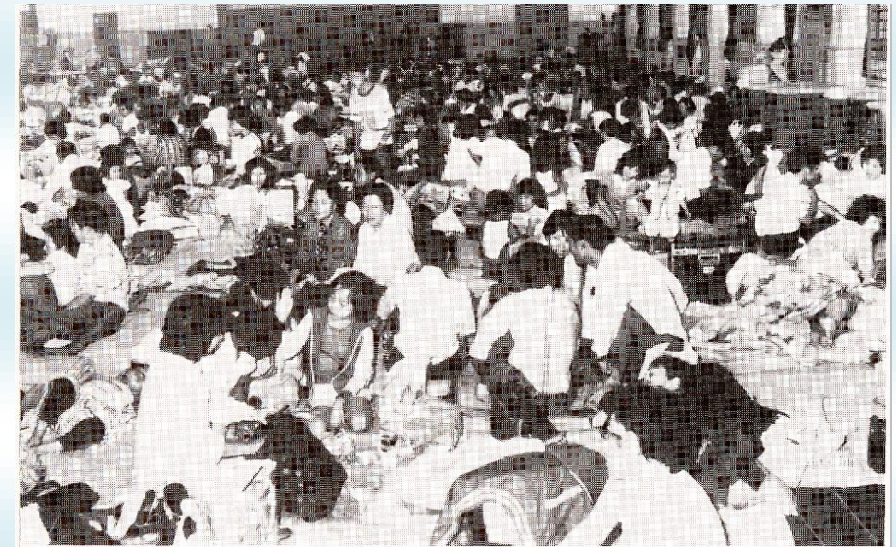
昭和56年8月江別市集中豪雨・江別小学校避難所